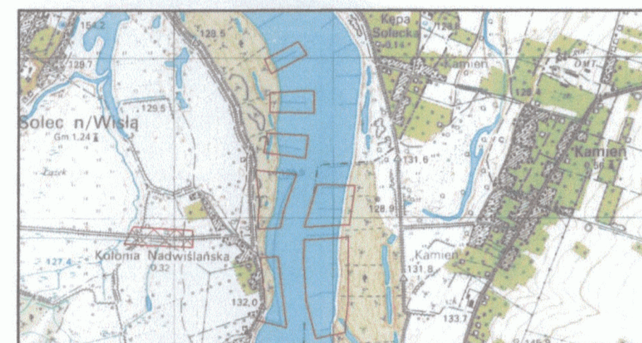
Szkic lokalizacji 1:25000

STAROSTWO POWIATOWE W LIPSKU Powiatowy Ośrodek Dokumentacji Geodezyjnej i Kartograficznej W obszarze oznaczonym linią przerywaną... dokonano aktualizacji treści mapy zasadniczej. Dokumenty z pomiaru uzupełniono do zasobu powiatowego w dniu 2011-05-16 i zaevidencjonowano pod nr 2011-05-16/101 Niniejsza mapa może służyć do celów projektowych. Projektowane obiekty budowlane wymagające pozwo- lenia na budowę podlegają wytyczeniu i inwentaryzacji powykonawczej przez jednostki uprawnione do wyko- nywania prac geodezyjnych. Lipsko, dnia 05-16-2011 r. p. STAROSTA Naczelnik Wydziału Geodezji, Kartografii, Katastru i Nieruchomości