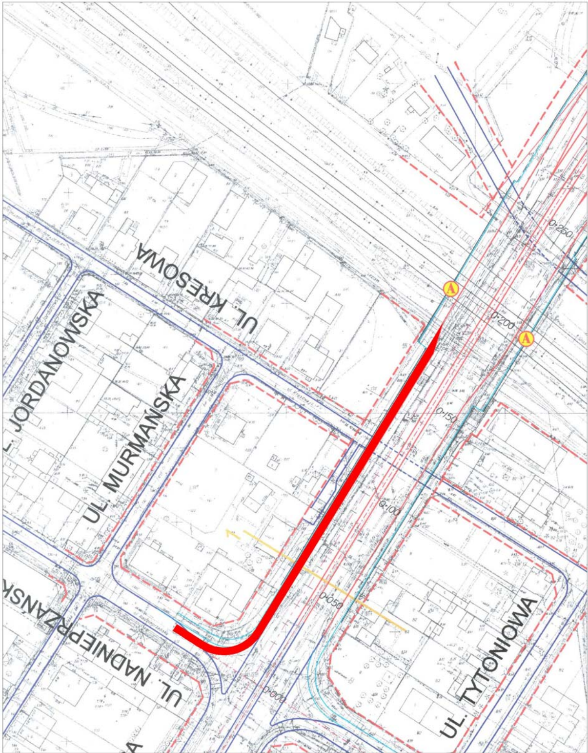
zał. nr 3