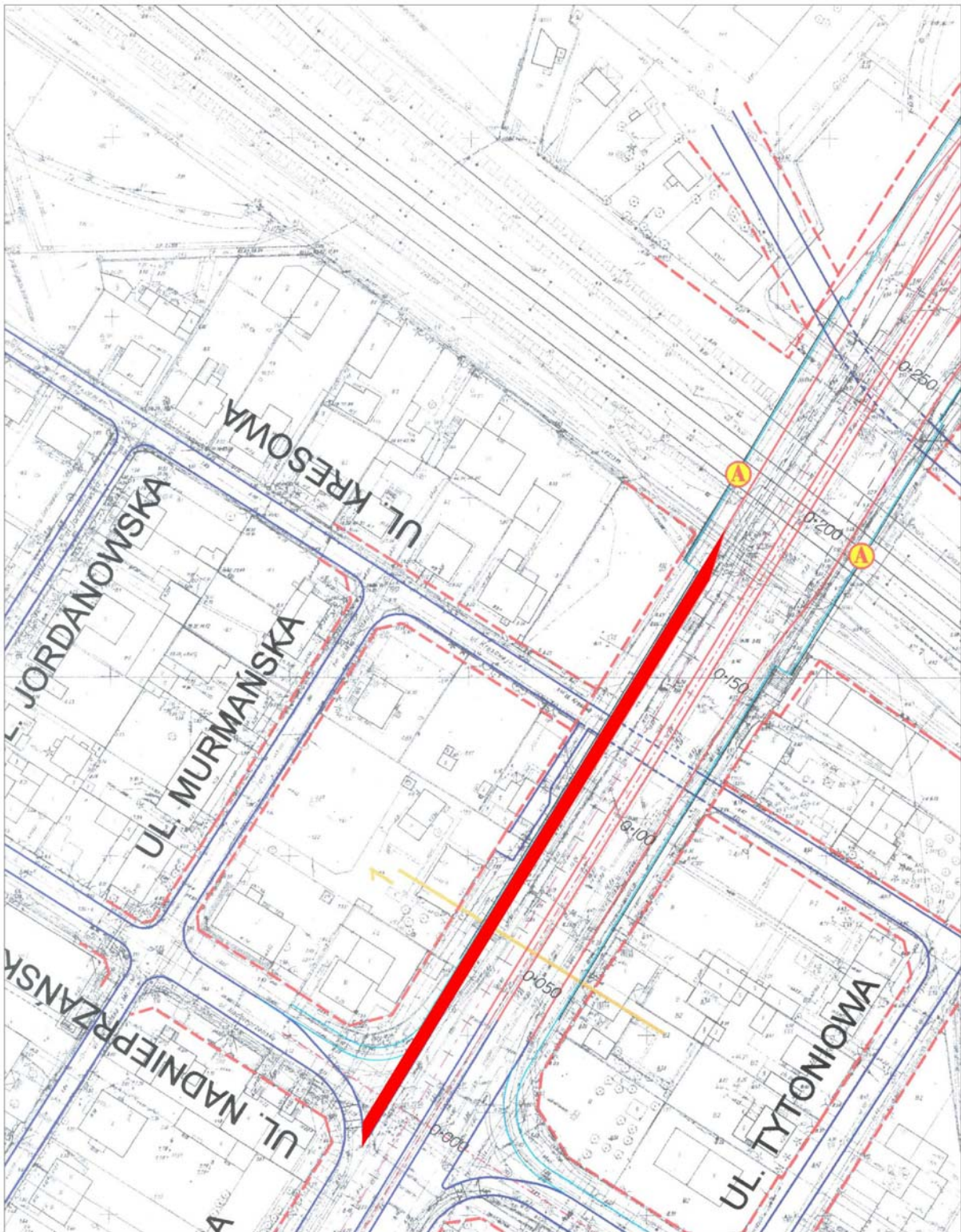
zał. nr 1